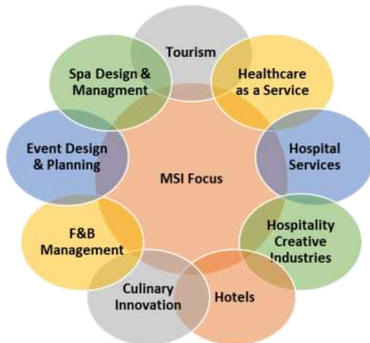
แผนภาพ: องค์ประกอบของภาคการบริการสาขาต่าง ๆ ที่หลักสูตรให้ความสำคัญ

จากการเปลี่ยนแปลงรูปแบบเศรษฐกิจของโลกในปัจจุบัน ทำให้ภาคบริการกลายเป็นอุตสาหกรรมที่มีความสำคัญต่อระบบเศรษฐกิจ (70% ของ GDP โลก) และมีการเติบโตอย่างต่อเนื่อง โดยภาคการบริการนี้สามารถสร้างงานและสร้างโอกาสในการพัฒนาเศรษฐกิจและสังคมของประเทศ ดังนั้น แนวคิดของหลักสูตรวิทยาศาสตรมหาบัณฑิต สาขาวิชาการออกแบบการจัดการบริการ จึงเน้นการใช้แนวความคิดใหม่ วิธีการหรือเครื่องมือใหม่ รวมถึงกระบวนการที่ดีกว่า มีประสิทธิภาพมากกว่าในการจัดการให้บริการประเภทต่าง ๆ เพื่อตอบสนองความต้องการและความพอใจของลูกค้าที่แตกต่าง นอกจากนี้ ยังมุ่งเน้นการพัฒนาทักษะของผู้เรียนด้านความคิดเชิงสร้างสรรค์ การใช้ความคิดเชิงออกแบบเพื่อสร้างนวัตกรรมในการให้บริการรูปแบบต่าง ๆ สำหรับทั้งองค์กรขนาดเล็ก กลาง ใหญ่ โดยยึดหลักของความยั่งยืนของทรัพยากรและความรับผิดชอบต่อสังคมและสิ่งแวดล้อมในการประกอบธุรกิจให้บริการ